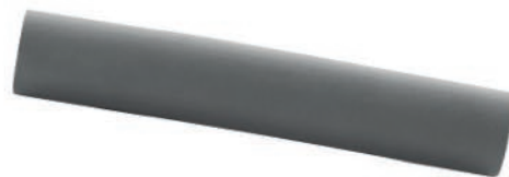
GOMA ESPUMA DEL VOLANTE