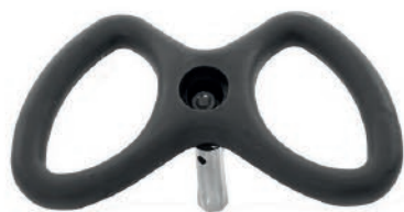
VOLANTE DE DIRECCIÓN