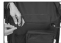
Hebilla de seguridad