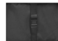
Hebilla de seguridad de plumón

El cambio del estado del asiento y de la cesta para dormir se logra mediante cuatro cierres de seguridad en la parte inferior, que transforman los cuatro cierres de seguridad inferiores en modo de asiento. Suelte la hebilla de seguridad inferior al modo de reposo.