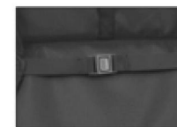
Hebilla de seguridad media