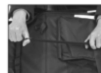
Hebilla de ajuste del respaldo