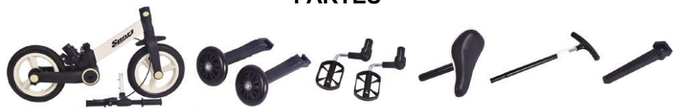
CUERPO Y MANUBRIO